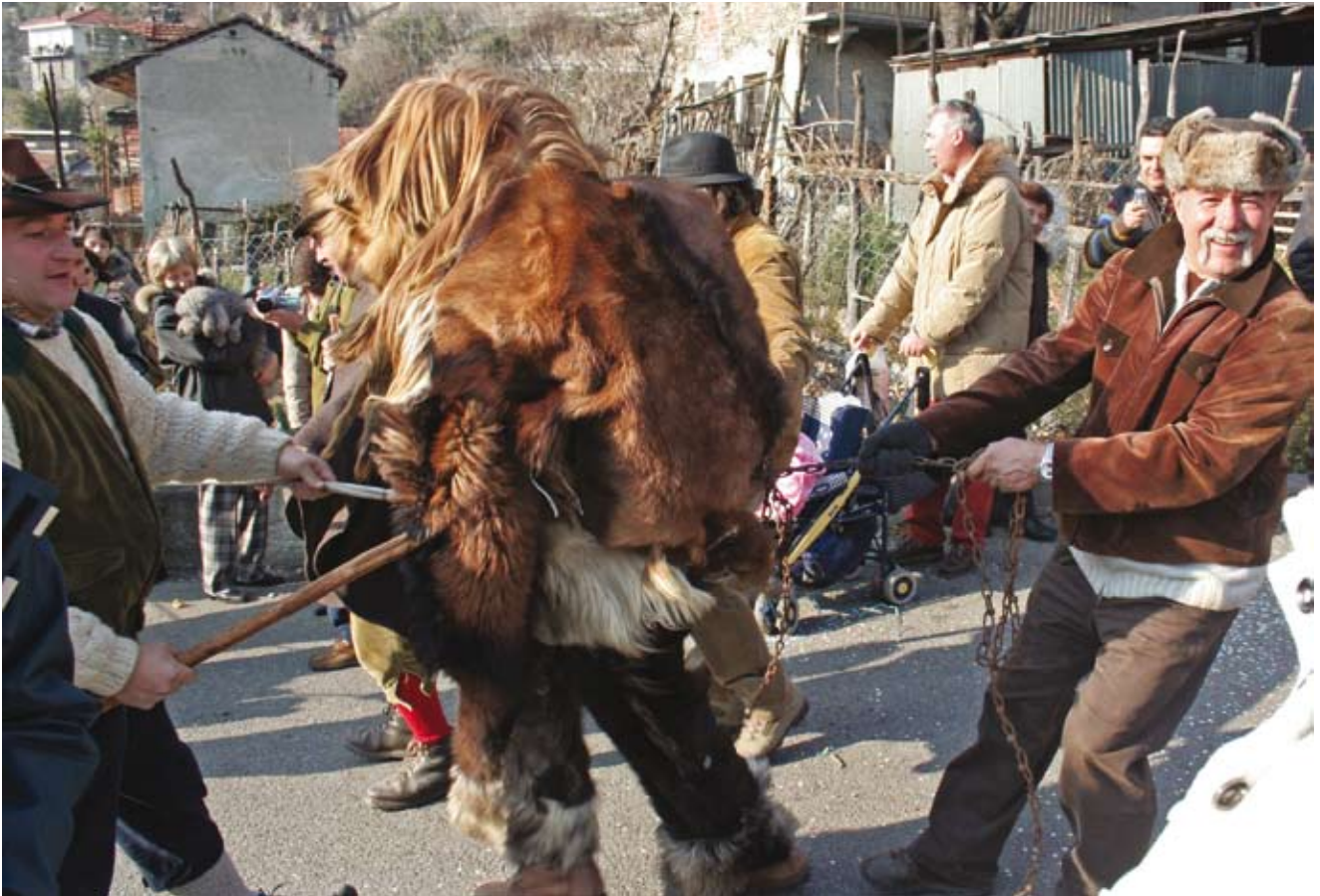
Durante la discesa lungo la via principale di Urbiano, l'Orso, legato con catene di ferro e via via sempre più ubriaco, viene apostrofato, stratonato e bastonato dai cacciatori; usa reiteratamente l'imbuto per amplificare le sue urla beluine