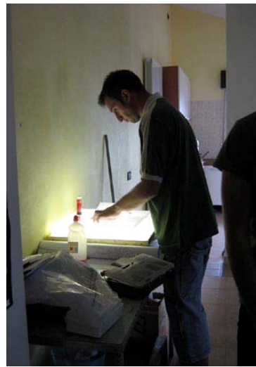
Momenti di lavoro e relax