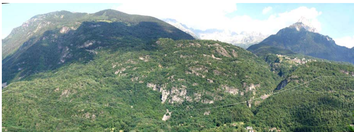
Visione panoramica dell'area rupestre di Paspardo, Valcamonica

14 Luglio - 4 Agosto 2008 Paspardo, Lombardia - Italia